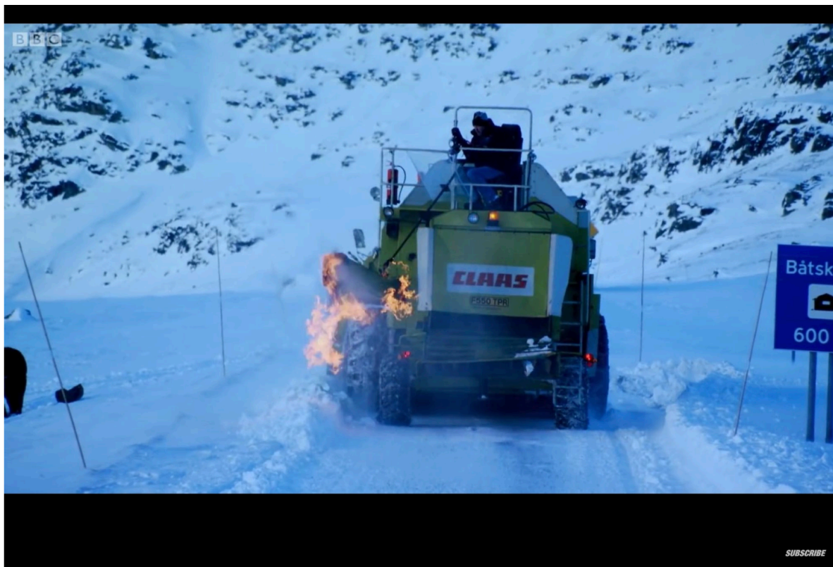
MED FLAMMEKASTER: I 2011 la Top Gear en hel episode av serien til Beitostølen og Bygdin-området. En flammespyttende ombygd skurtresker skulle testes ut som brøytemaskin.