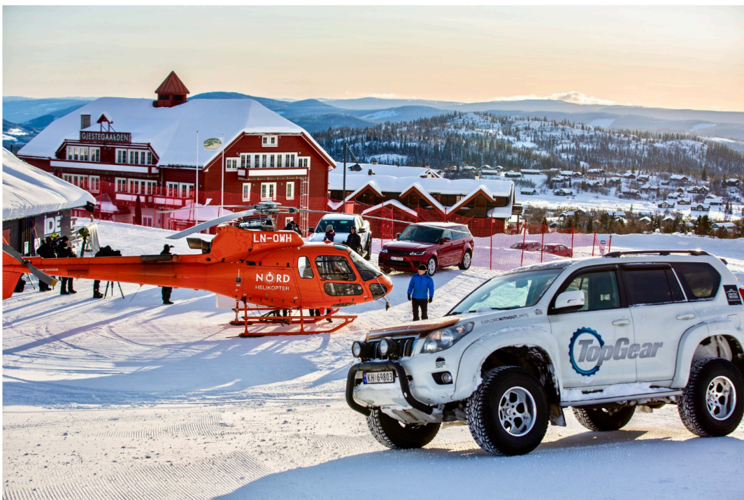
I BAKKEN: Tor Gear har besøkt Beitostølen flere ganger.

Det er slett ikke første gang en bilprodusent satser store penger på å få de beste bildene i et særegent landskap. Utallige bilmerker er tidligere blitt fotografert og filmet i disse kulissene for internasjonal lansering. Peugeot la store penger i en film fra toppen av Valdresflye i 2016 da de lanserte en ny SUV. Rundt 70 personer, halvparten av disse fra Frankrike, to semitrailere, 30 biler, kokk og cateringtelt, security med mer inntok den gang Valdresflye. Også den gang var teamet nøye med hvem som fikk komme inn på filmteamet.