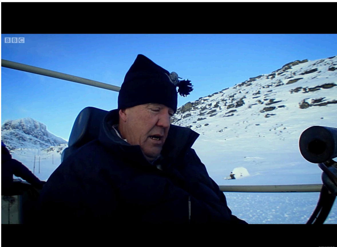
FANT VINTEREN: Snøen var borte i England da Jeremy Clarkson og de andre gutta i Top Gear skulle teste snøbrøyting i 2011. Snøen fant de ved Bitihorn.