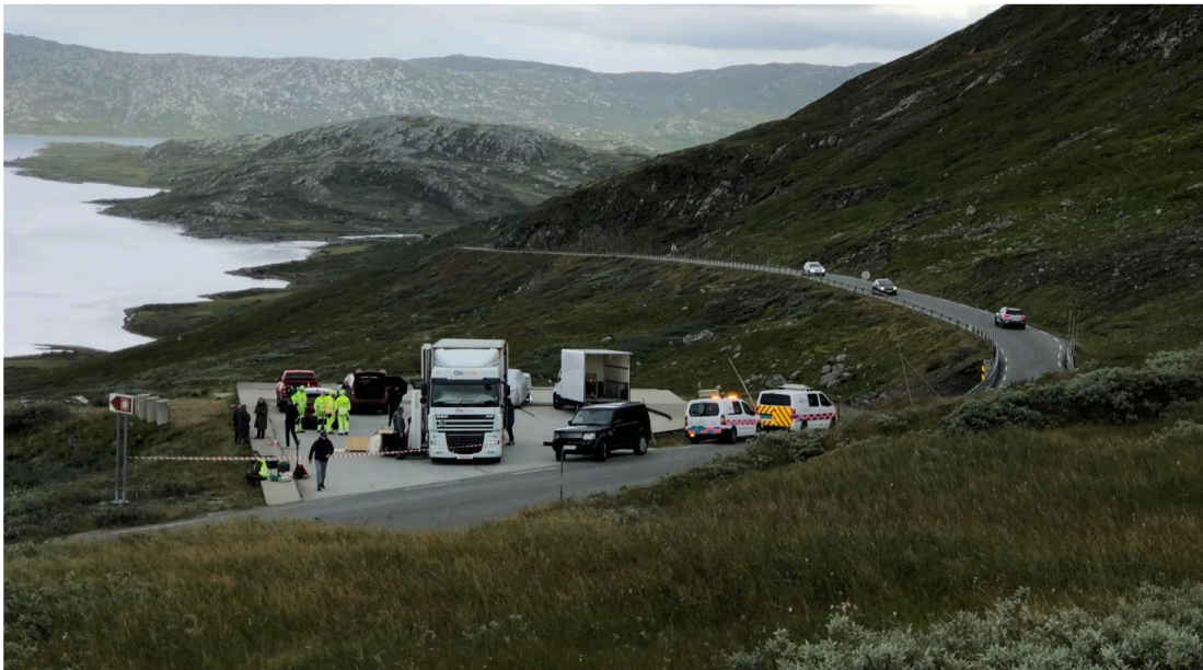
I VEIKANTEN: På en av de faste utsiktsparkeringene ved turistveien over Valdresflye jobber et stort team med bilder til en billansering.

– Det er forbudt! sier han, mens biltrafikken går tett forbi.