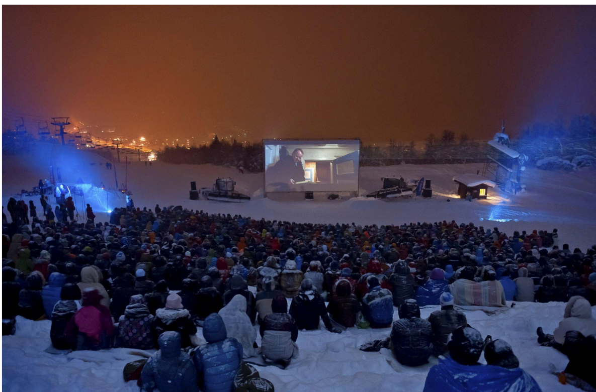
PREMIERE: Stellan Skarsgård var også til stede under førpremieren på Hans Petter Molands Gullbjørn-nominerte film «Kraftidioten» som er innspilt på Beitostølen i 2014.

Filmen hadde sin premiere på Beitostølen med stor utendørs visning i alpinbakken.